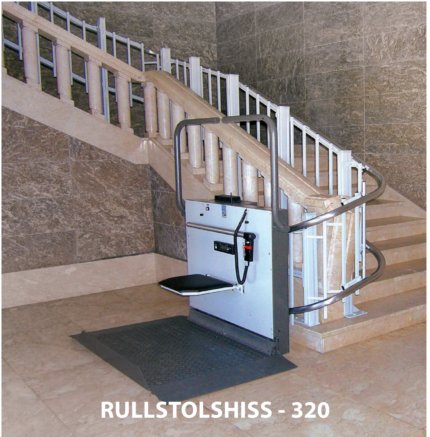
RULLSTOLSHISS - 320